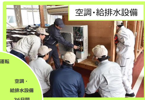
空調・給排水設備